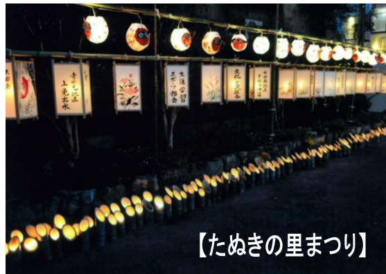
【たぬきの里まつり】

「みんなで子育て明るい太田」をテーマに大人と子どもが一緒になり、地域の行事等に参加しての町づくりをしています。8月には、小・中学生をはじめ保護者や学校関係者、関係機関、地域の方々、約200名の参加を得て、第12回青少年健全育成住民パレードが行われました。