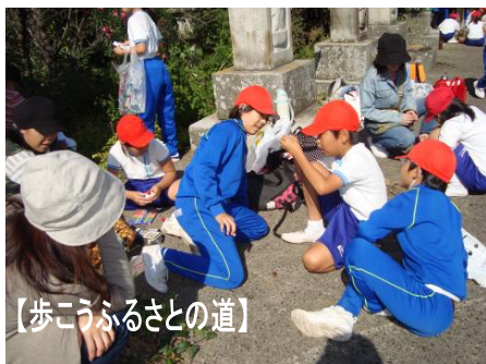
【歩こうふるさとの道】

他にも夏まつりや秋まつりなど、子どもたちが楽しく参加できる地域の行事がたくさんありますが、各種団体が知恵と力を出し合い、子どもたちの健全育成に努めてまいりたいと思っています。