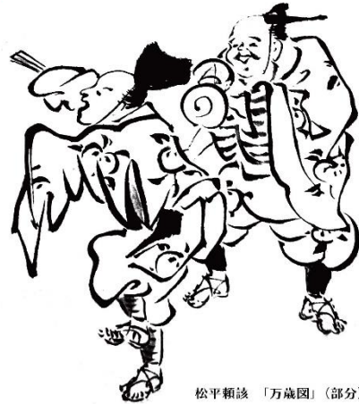
松平頼該「万歳図」(部分)