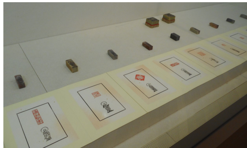
宮本 瑞邦 刻