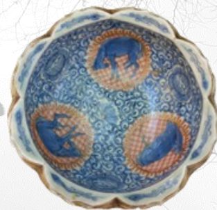
高松市香南歴史民俗郷土館