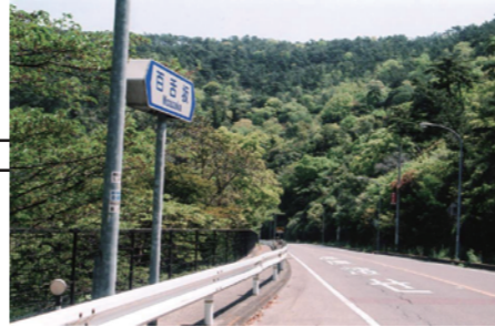
もずが 百舌坂 (寛が百舌狩りを楽しんだことから名づけられた。)