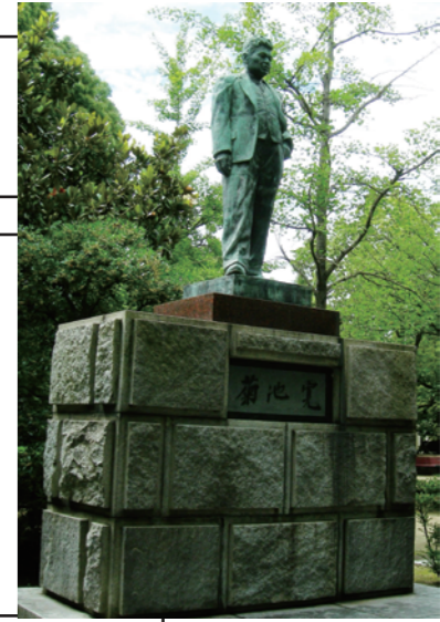
どうぞう 菊池寛銅像