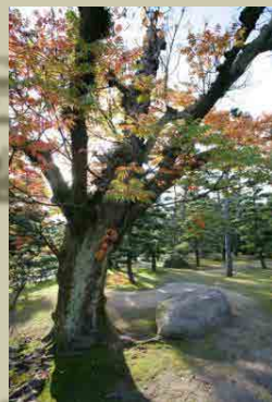
披雲閣庭園のハゼの紅葉