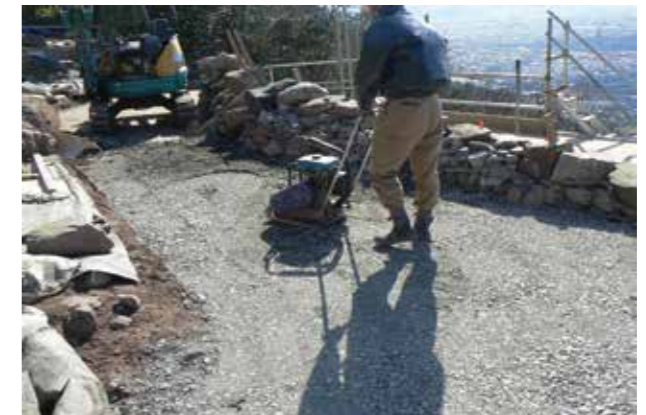
⑯吸出し防止層転圧状況