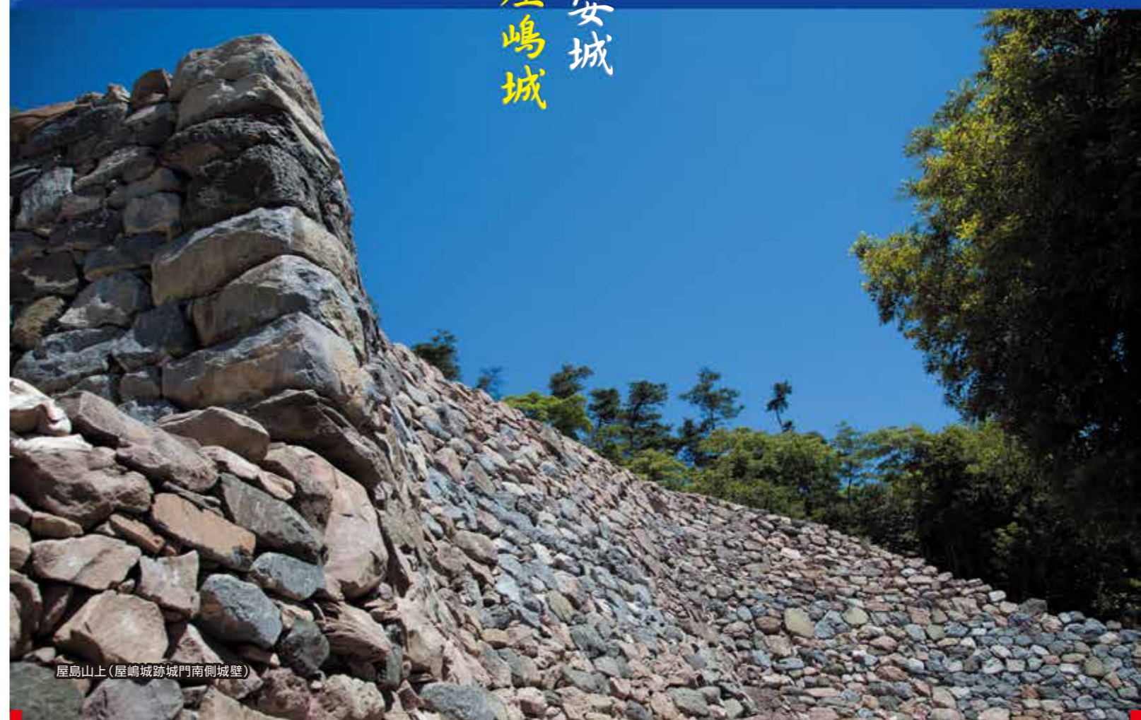
屋嶋山上(屋嶋城跡城門南側城壁)