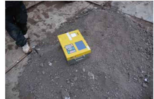
⑫土の含水比等の確認