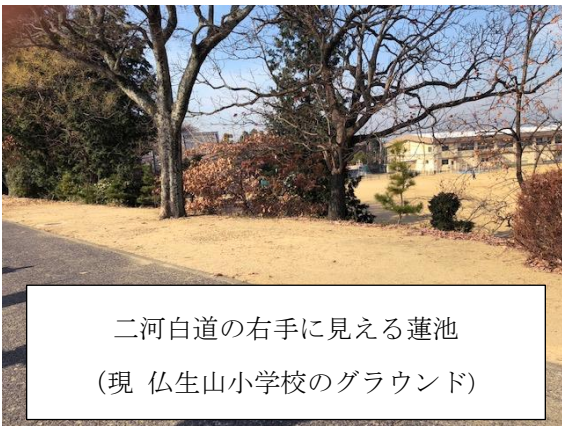
二河白道の右手に見える蓮池 (現 仏生山小学校のグラウンド)

総門をくぐり、黒門へと続く参道の右側には、水の河に見立てた蓮池（今は埋め立てられ、小学校のグラウンドになっている）が、左側には、火の河に見立てた前池があります。総門をくぐったすぐ右手にある十王堂で十王による裁きを受けた後、二河白道を渡り、黒門から先に広がる極楽浄土へ辿りつくという配置になっています。