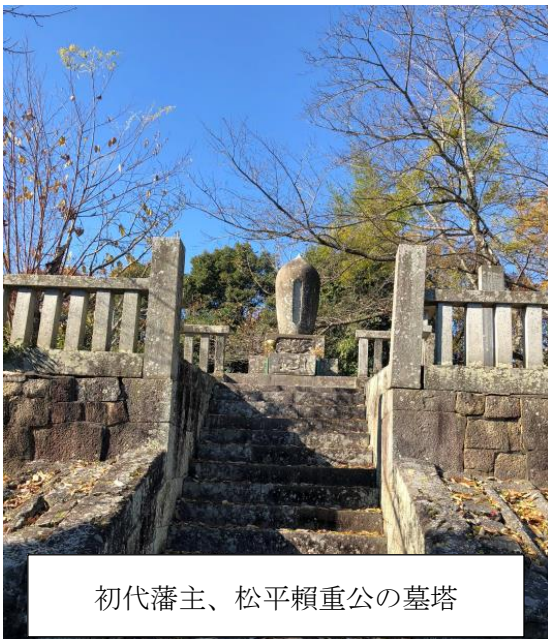
初代藩主、松平頼重公の墓塔

また、本来であれば、法然上人及び松平家一族しか葬られない般若台に、頼重公御逝去の際に殉死した家臣の高井角右衛門の墓や、九代藩主の奥方