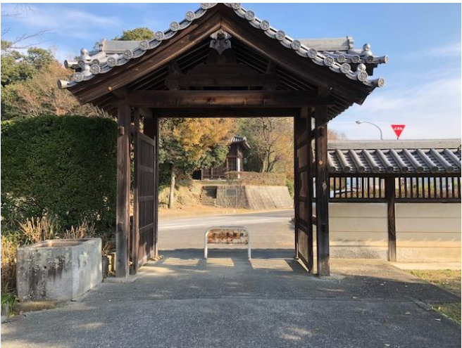
総門から振り返る