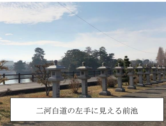
二河白道の左手に見える前池