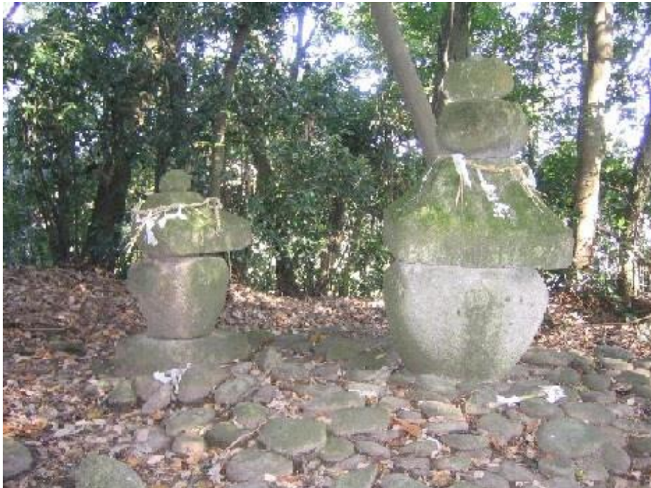
神内家墓地石塔群

また、神内城跡北の山裾には、鎌倉時代後期から室町時代にかけて十数基の五輪塔がほぼ原位置を保ったまま墓地を形成しており、神内城主の墓といわれています。この神内家墓地石塔群は、平