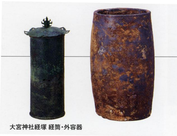
大宮神社経塚 経筒・外容器