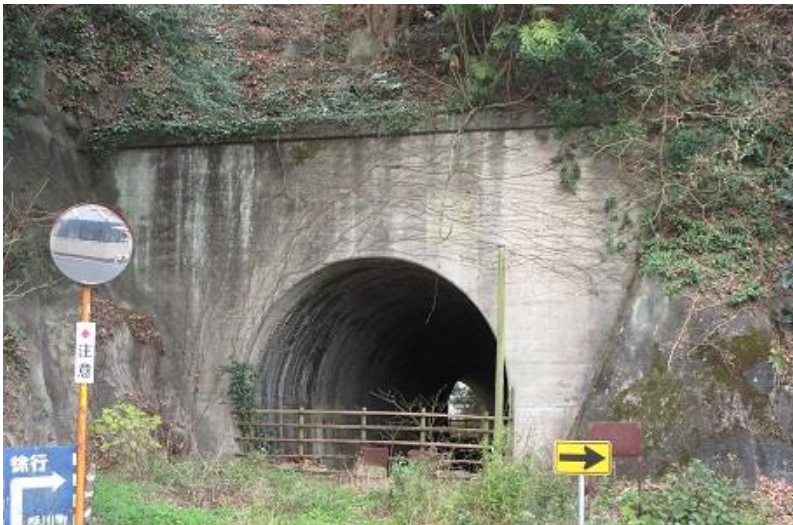
カラト（伽羅土）トンネル（北側）

定期便は一両で運行されていたが、団体客や塩江の花火大会、菊人形展、少女歌劇団の演劇など