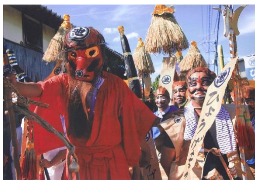
天狗姿で練り歩く人々 （ひょうげ祭り）

元来、浅野村の土地は高低差がはなはだしく荒地が多かった。藩では開墾をさせたが水の便利が悪く灌漑に困ってい