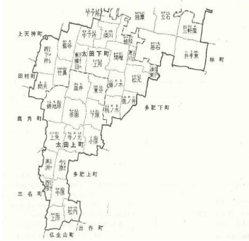
太田地区（旧太田村）略図