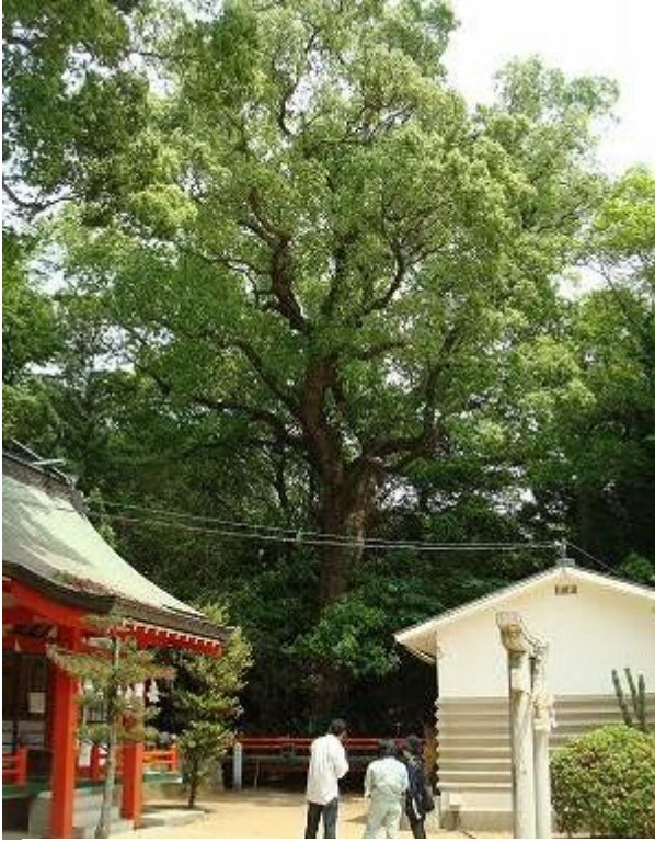
廣田八幡神社境内のクスノキ

し、他にもツブラジイ・クロガネモチ・センダン・クヌギ・クロマツ等の大木も見られ、中層以下には、ヤブツバキ・ヤブニツケイ・ネズミモチ・ヒサカキが多い。若宮神社の北側には、樹高二十メートル、幹回り四・四五メートルもの大きなクスノキがあり昭和五十二年に市の名木条例に基づき「高松市の名木」に指定されている。また、