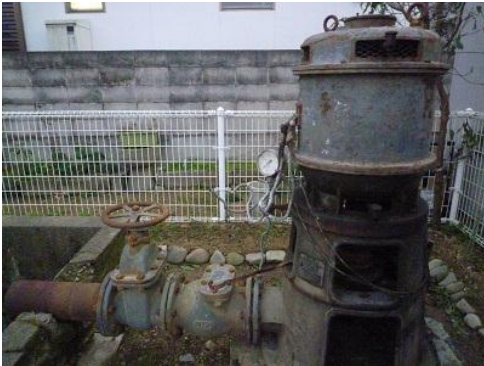
井戸（鑿井）のポンプ

周辺地域は収穫皆無という状況になった。そこで同十六年（一九四一）に出水の水を補うために井戸（鑿井）が掘られた。総工費三万八千余円をかけて、ポンプで水揚げを行う、当時としては近代的なものが設置され、今もそのポンプが残されている。ちなみに、鹿ノ井出水とは、太田地区で最も大きな出水で、どんな旱魃でも枯れたことがないと言われており、保安三年（一一二二）の大旱魃の際、白髭の老人が鹿となつて現れ、この地で泉を掘り当て、人々を救ったという伝説が残っている。