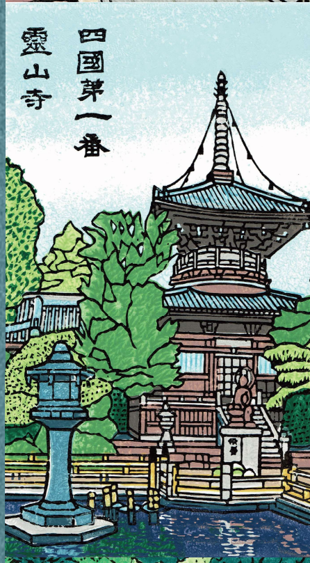
四國第一番 靈山寺