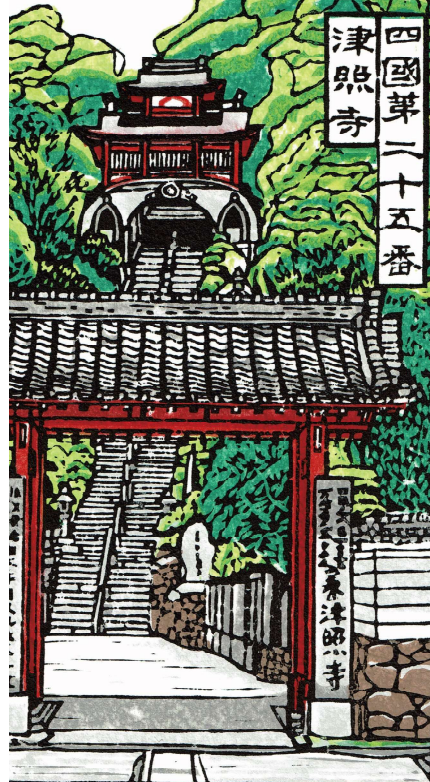
四國第二十五番 津照寺