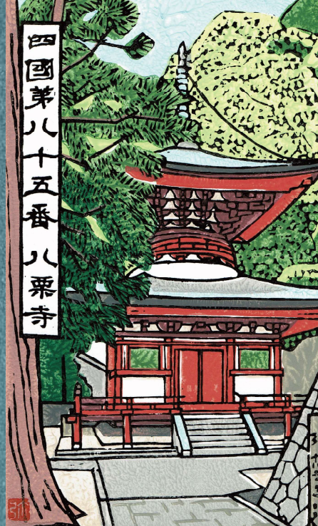
四國第八十五番 八栗寺

主催：NPO 法人 遍路とおもてなしのネットワーク 後援：香川県、高松市、四国遍路世界遺産登録推進協議会