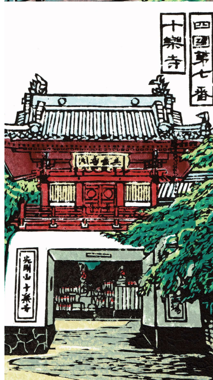
四國第七番 十津寺