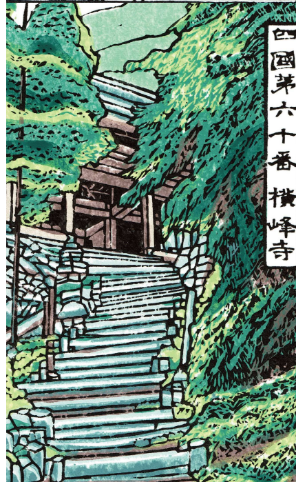
四國第六十番 横峰寺