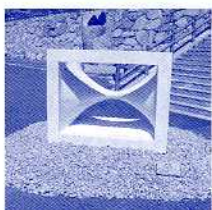
2003石のさとフェスティバルより

石の彫刻コンクールとは…石の彫刻コンクールは、新進彫刻家の登竜門として開催され、国内外から応募のあった石の彫刻作品を審査委員が審査し、厳選された入選作品43点が決定しました。これらの入選作品は3つの会場で屋外石彫展として2ヶ月間展示され、特に優秀な作品の作家は、石の彫刻国際シンポジウムに招待されます。